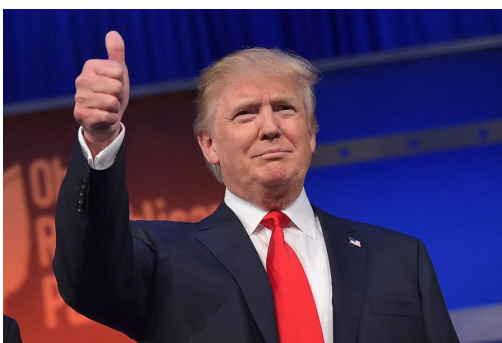
ดอนัลด์ ทรัมป์ (Donald J. Trump)

“หากปราศจากแรงปรารถนา คุณจะไร้พลัง และเมื่อขาดซึ่งพลัง ...คุณย่อมไม่เหลืออะไร”